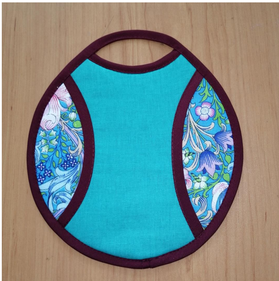
Технический рисунок прихватки.

Техническим заданием является изготовление швейного изделия «Прихватка», используя хлопчатобумажную ткань - 2 расцветок. Прихватка состоит из 3 деталей кроя, 1 детали прокладочного материала и 1 метра косой бейки.